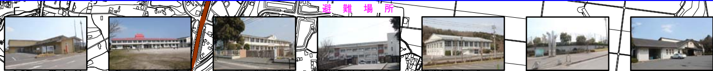
①唐原コミュニティセンター ②町立唐原小学校 ③町立南吉宮小学校 ④町立上毛中学校 ⑤上毛町健康増進施設 ⑥上毛町大池公園多目的運動広場 ⑦ふれあいの家京葉

このハザードマップは、上毛町上唐原に位置する池田池が地震により決壊した場合の浸水被害想定と避難対策等の情報を分かりやすく皆さんに提供することを目的に作成したものです。