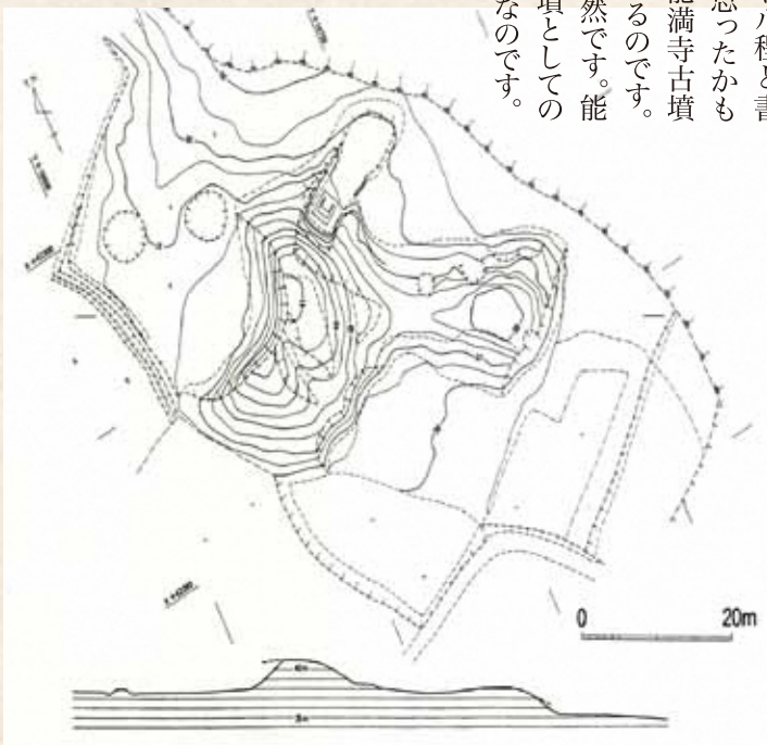
▲西方古墳地形測量図

こうげのみどま 上毛風土記 Vol.160 せんぼうこうえんぶん 前方後円墳 広報四月号、五月号と続けて、能満寺古墳(3号墳)、西方古墳の上毛町内で確認されている二基の前方後円墳について紹介してきました。今更ながら前方後円墳というのは、古墳の形式のうちの一つで、測量図などを上から見ると鍵穴のような形をしているのが特徴で、畿内ヤマト王権とのつながりを示す古墳です。二基の古墳を二ヶ月にわたり一基ずつ説明してきたので、皆さんには形がよく似ているなといった印象くらいしか残っていないかもしれません。古墳の大きさを示す全長としては、能満寺古墳(3号墳)は三十〜三十五メートル程、一方西方古墳のほうは五十六メートル程と書きました。ふうん大きいなあと思っただけかもしれませんが、実は西方古墳は能満寺古墳(3号墳)の二倍程の大きさになるのです。同じ縮尺の図面で見ると一目瞭然です。能満寺古墳(3号墳)は、前方後円墳としての西方古墳の後円部分程の大きさなのです。