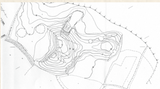
▲西方古墳地形測量図