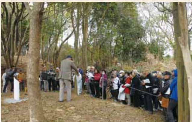
▲能満寺古墳群現地説明会風景