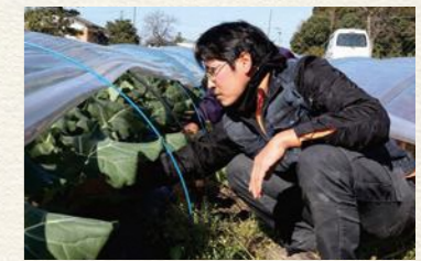
最も収益率の良い時期に合わせて出荷できるよう毎年試行錯誤しているとのこと。