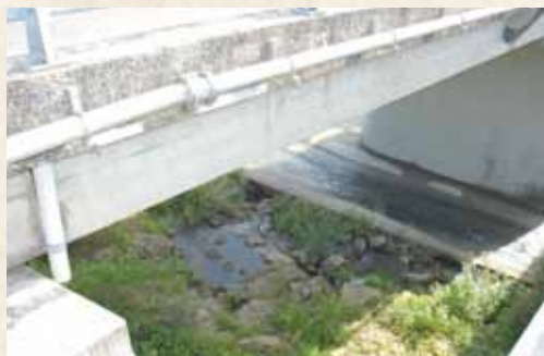
▲現在の橋脚と宇島鉄道時代の橋脚跡