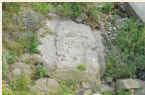
▲宇島鉄道時代の橋脚跡

上毛風土記 こうげのみどき なるみ 鳴水橋 ぼし Vol.148 全長十七・七キロメートルの宇島鉄道には合計四本の橋が架かっていました。すなわち、線路が四本の川の上を跨いでいたことになりました。岩岳川、佐井川、黒川、友枝川の四本です。そのうち岩岳川は豊前市内を流れており、佐井川は豊前市と上毛町の境になります。上毛町内では黒川と友枝川の二本の川に橋が架けられていました。 資料には橋梁の長さが残されています。岩岳川には、四十尺(約十二メートル)の橋梁が一本。佐井川には四十尺の橋梁が五本で、橋の長さは全長約六十メートル程になります。黒川には岩岳川と同じく四十尺の橋梁が一本。そして友枝川には四十尺の橋梁が二本と、三十尺(約九メートル)の橋梁が一本で、橋の長さは全長約三十三メートル程になります。岩岳川や黒川には橋梁が一本ですので、川の両端に橋台があるだけです。佐井川は橋梁が五本ですので、橋の途中に橋脚が四本、同様に友枝