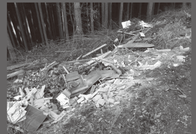
※たんすや木材などの不法投棄