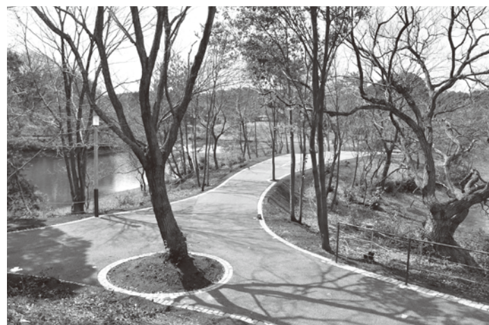
▲平成28年度に整備した東側の遊歩道