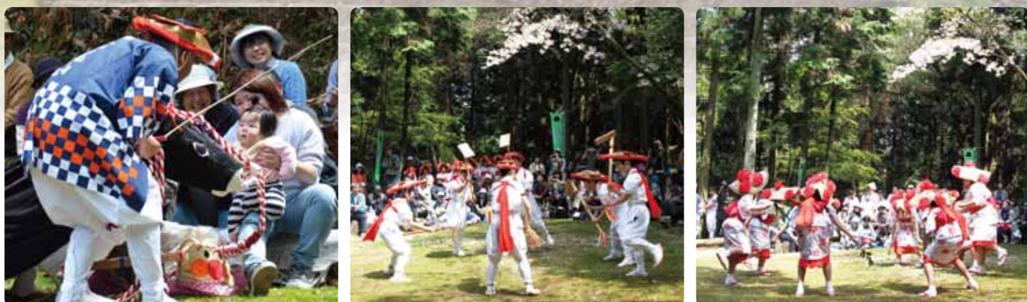
表紙の写真は4月16日(日)に開催された、松尾山お田植え祭の様子です。

今後は、町のフレッシュな食材とイタリアの上質な食材を使って、上毛町ならではのピッツァを作り、九州全域に上毛町を広めていきたいです。ピッツァ以外にもお肉料理やサラダ、スイーツもご用意していますので、ぜひお立ち寄りください。