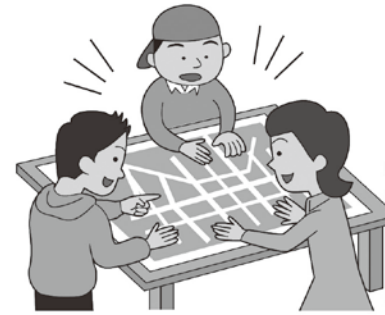
ハザードマップ(防災マップ)を事前に確認し、避難するために必要な情報を集めましょう。

どこに避難すればよいのか、また避難所へはどのような道を通ればよいのか、準備する持出品などの情報は、ハザードマップ(防災マップ)を見て、事前に確認しておきましょう。