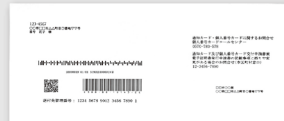
①宛名台紙(お問い合わせ先記載あり)