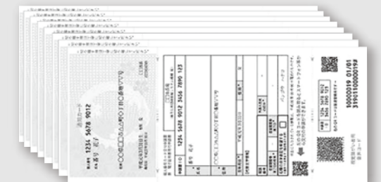
②通知カード +個人番号カード交付申請書兼電子証明発行申請書 +音声コード台紙