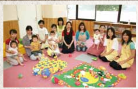
平成21年 2009 上毛町子育て支援センター開設