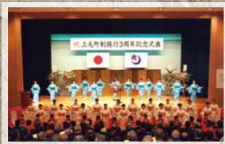
平成20年 2008 上毛町制施行3周年記念式典