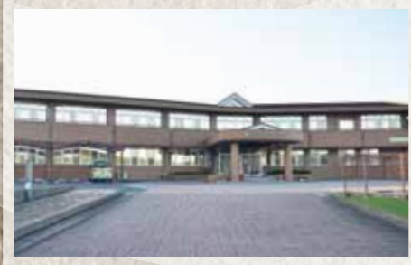
平成23年 2011 上毛町国民健康保険直営診療所 特別養護老人ホームたいへい苑 デイサービスセンター さざんか荘民営化