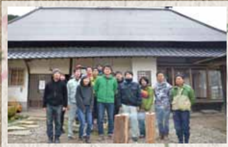
平成26年 2014 上毛町田舎暮らし研究交流サロン開設