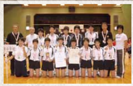
平成18年 2006 築上東中バレーボール部 全国大会準優勝