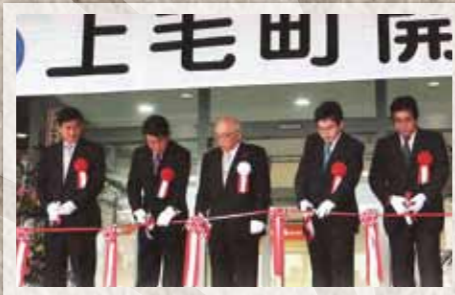
平成17年 2005 10月11日上毛町発足