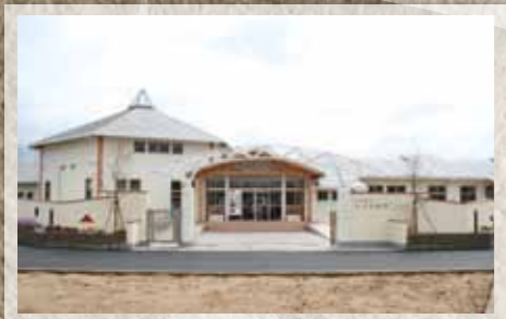
平成19年 2007 大平保育所開所