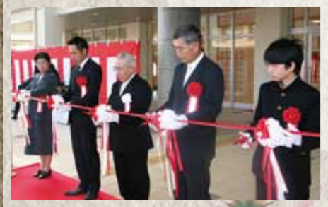
平成22年 2010 築上東中学校体育館改築工事竣工