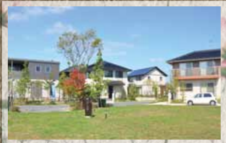
平成25年 2013 コモンパーク上毛「彩葉」分譲開始