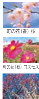
町の花(春)桜 町の花(秋)コスモス 町の木 梅