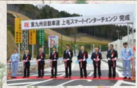
平成27年 2015 東九州自動車道上毛 スマートインターチェンジ完成