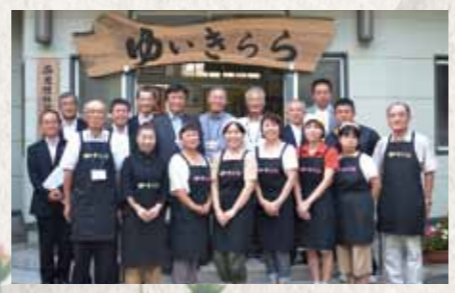
平成24年 2012 西友枝体験交流センター 「ゆいきらら」オープン