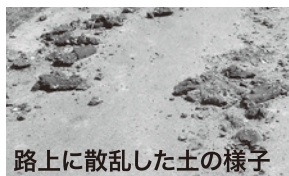
路上に散乱した土の様子