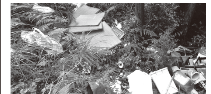
※引越しごみと思われる不法投棄

「きれいな町に住みたい」、それはみんなの願いです。しかし、わずか一握りの心ない人たちの「不法投棄」という行為によって、多くの人が迷惑している現実があります。不法投棄は、違反者に「5年以下の懲役若しくは1,000万円以下の罰金」が科せられる重罪です。不審な人や車両を見かけた場合は、住民課住民福祉係または豊前警察署まで連絡をお願いします。