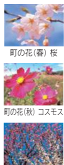
町の花(春)桜 町の花(秋)コスモス 町の木 梅