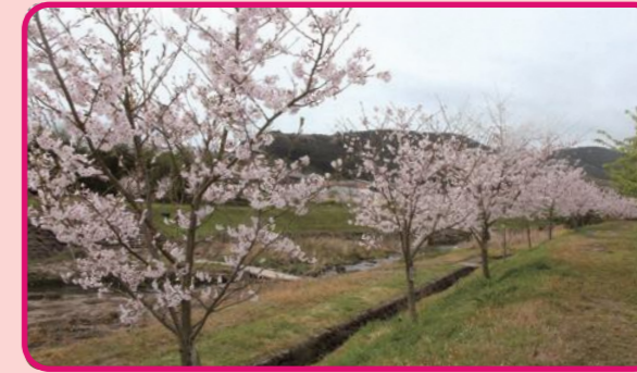
桜散歩にぴったり！ 友枝川農村公園 (土佐井)