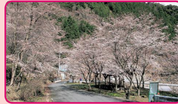
絶景の桜街道！ 岩屋さくら公園 (東上)