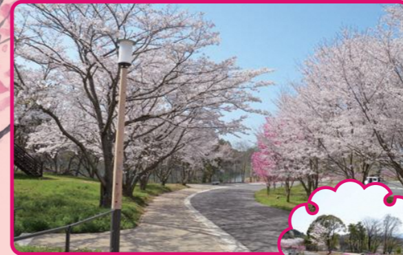
桜並木をウォーキング！ 大池公園 (下唐原)

寒い毎日が続いていますが、町の花の一つである“桜”の季節が近づいてきました。広報上毛では、一足先に春の訪れを感じられる町内の桜スポットを紹介します。