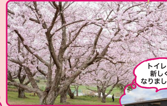
満開の桜に囲まれて！ 牛頭天王公園 (垂水)