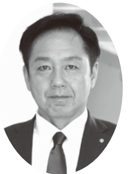
町長 坪根 秀介