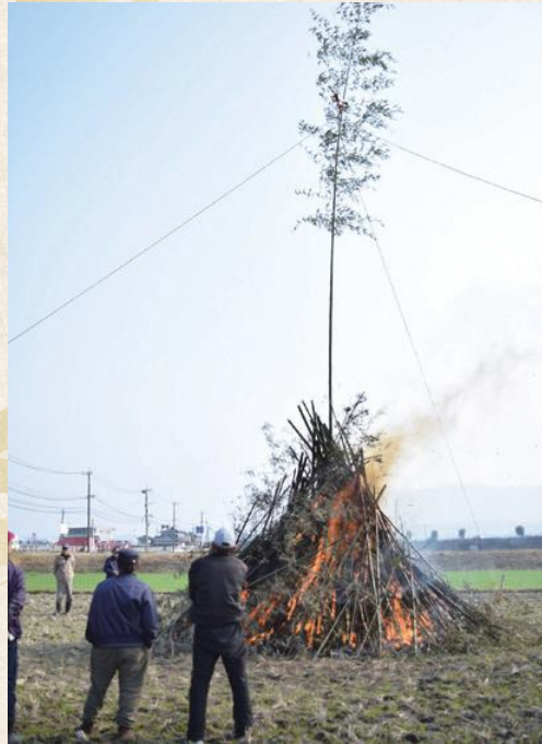
▲昨年のどんど焼きの様子

しめ縄やしめ飾りは、本来は十二月十三日のすず払い(大掃除のルーツ)が終わり、年神様をお迎えするのにふさわしい場になってから飾るものですが、地域によって異なり、現在では二十八日まで飾るようです。飾りを外す日も地域によって異なり、一月七日に七草がゆを食べた後、若しくは十五日の小正月の後に外すとされています。しめ縄やしめ飾りを外したら、地域や神社