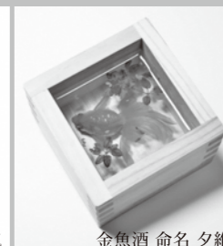
金魚酒 命名 夕雜