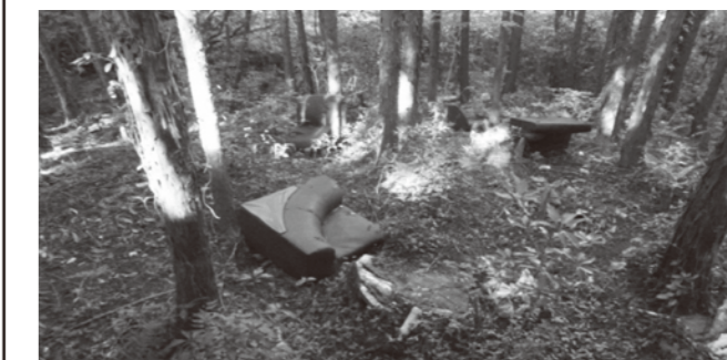
▲家庭ごみの不法投棄

また、不法投棄は違反者に「5年以下の懲役若しくは1,000万円以下の罰金」が科せられる重罪です。不審な人や車両を見かけた場合は、住民課住民福祉係または豊前警察署まで連絡をお願いします。