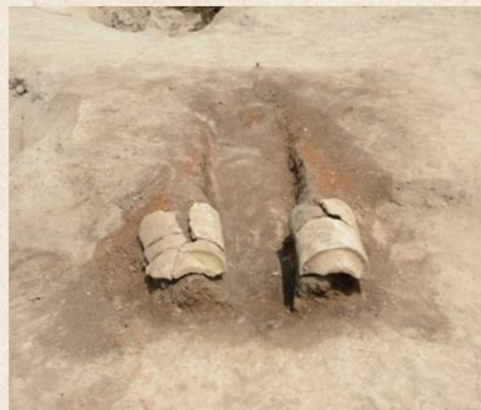
▲1号竪穴状遺構から検出された瓦転用カマド(南から)