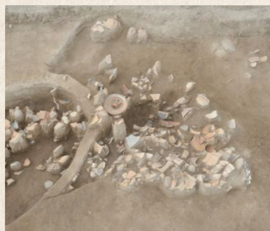
▲1号土器溜まり(西から)

上毛風土記 Vol.176 下唐原東屋敷遺跡 四月から半年にわたり町内の木造物や石造物を紹介してきました。今回は久々に埋蔵文化財である遺跡のお話です。遺跡名を下唐原東屋敷遺跡と言います。山国川の堤防拡張に伴い九州歴史資料館により調査されました。発掘現場が下唐原の恒久橋の近くだったので、近所の方のもとより、堤防を散歩された方など気付かれていた方も多しと思えます。 調査の結果見つかった主な遺構は、古墳時代中期頃から奈良時代にかけての竪穴住居跡三十九軒、古代末から中世にかけての竪穴状遺構一基、弥生時代中期頃の竪穴住居跡三軒、土坑四十九基、溝六条、溝状遺構四条、小児甕棺一基、円形溝状遺構一基、埋甕一基、土器溜まり一基、多数のピット等という内容でした。