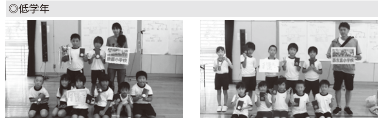
◎低学年 優勝 下唐EIGHT(唐原小)