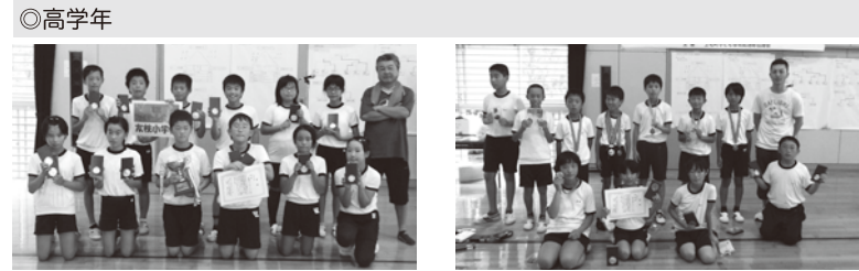
◎高学年 優勝 友枝ファイヤーレインボー(友枝小)

7月21日(日)、健康増進施設において、上毛町子ども会育成連絡協議会主催による「小学生ドッジボール大会」が行われました。町内の小学生184名(高学年9チーム、低学年9チーム)が参加し、熱戦が繰り広げられました。結果は以下のとおりです。