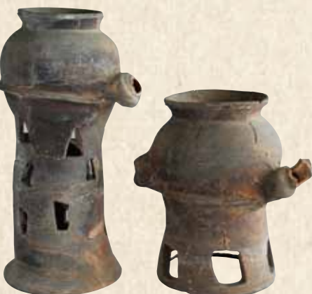
穴ヶ葉山古墳出土 山陰系子持壺

古墳とは3世紀中頃から7世紀頃(今から一七五〇〜一四〇〇年前)にかけて造られた墓です。遺体を納める空間は石材を積み重ねて造り、その石室を覆うように盛り土で墳丘を築きました。古墳は王や豪族の権力の象徴としての役割が強く、特に前方後円墳の場合は大和朝廷と関係を持っています。有力者が葬られる墓と考えられています。町内にも、下唐原に能満寺古墳、西方古墳という前方後円墳が造られています。