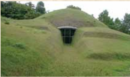
国指定史跡穴ヶ葉山古墳