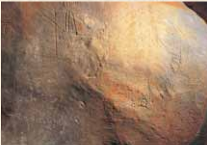
穴ヶ葉山古墳線刻画 穴ヶ葉山古墳の石室内には、鳥・木の葉・魚などの線刻画があります。