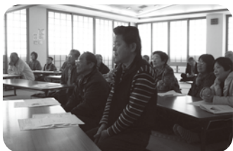
▲食育ボランティア等を対象とした食育講演会