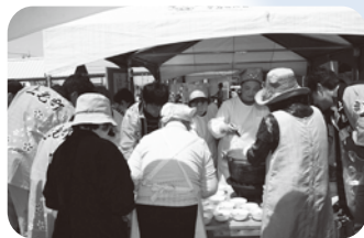
▲上毛汁無料配布(上毛祭)