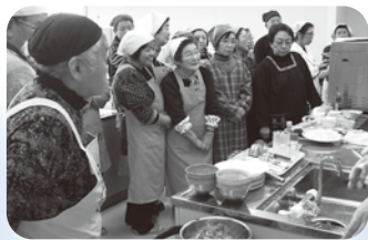
▲食育ボランティアを対象とした調理講習会

地域や関係団体などが連携・協働し、関係者が一体となった食育の取り組み、暮らしやすいまちづくりを創生しています。