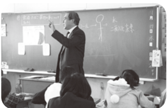
▲南吉富小6年生の食育学習