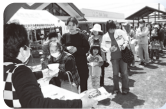
▲おにぎり無料配布(上毛祭)

自然豊かなまちの特性を生かして、安全、安心の食生活を支える農林水産業の振興、すばらしい歴史遺産と農産物などを活用した観光立町を進めています。