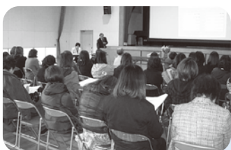
▲南吉富小保護者を対象とした講演会

一人ひとりが「食」に関する正しい知識や望ましい食習慣を身につけ、「食」を大切にすることを養い、健全な食生活を実践、継続できるように子どもから高齢者まで各世代に応じた食育を推進していきます。