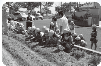
▲大平保育所大豆蒔き