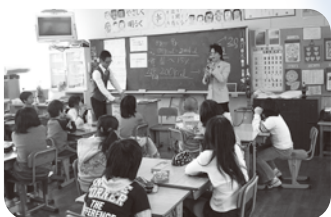
▲南吉富小3年生の食育学習