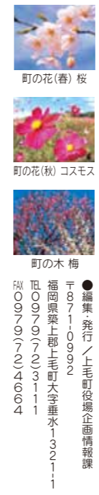
町の花(春)桜 町の花(秋)コスモス 町の木 梅

●編集発行/上毛町役場企画情報課 〒871-0002 福岡県築上郡上毛町大字垂水1-3-2-11 TEL 0979-723-111 FAX 0979-724-664