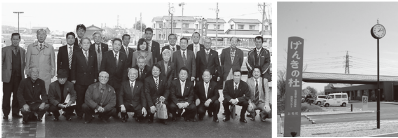
豊前ロータリークラブの皆さん

3月18日(木)、豊前ロータリークラブ創立50周年記念事業の一環としてげんきの杜に寄贈された太陽電池式電波時計の竣工式と、町へ贈呈式が行われました。