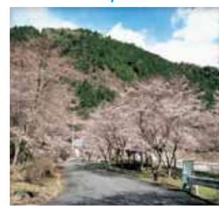
岩屋さくら公園(東上)