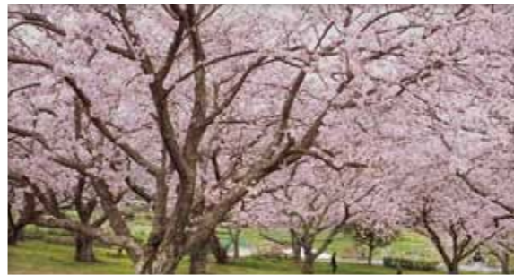
牛頭天王公園(垂水)