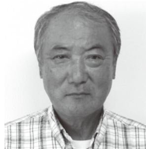
上毛町民生委員児童委員協議会