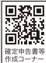
確定申告書等作成コーナー

納税額や還付額の確認ができるほか、作成した申告書をe-Taxで提出(電子申告)もしくは印刷して郵送で提出が可能です。 ※申告期間中は、24時間、土、日、祝日でもご利用できます。