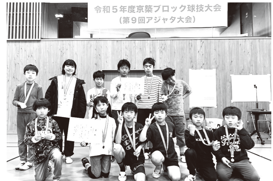
令和5年度京築ブロック球技大会 (第9回アジャタ大会)

京築7市町から17チームが参加し、上毛町からは低学年の部、高学年の部においてそれぞれ1チームが出場、低学年の部は第3位、高学年の部は準優勝という好成績を収めました。