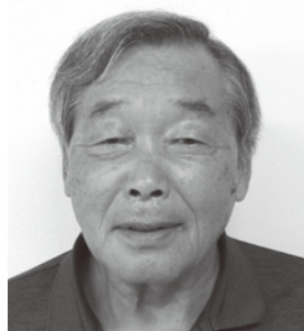
上毛町民生委員児童委員協議会