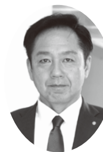
町長 坪根 秀介

新年あけましておめでとうございます。 町民の皆様には令和5年の希望に満ちた輝かしい新春を健康にお迎えになられたこととお慶び申し上げます。