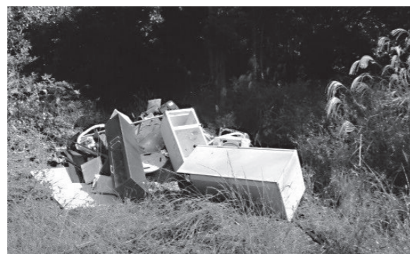
▲家庭ごみの不法投棄

●問い合わせ先 住民課 住民福祉係 TEL 72-3116 (内線143) 豊前警察署生活安全課防犯係 TEL 82-0110