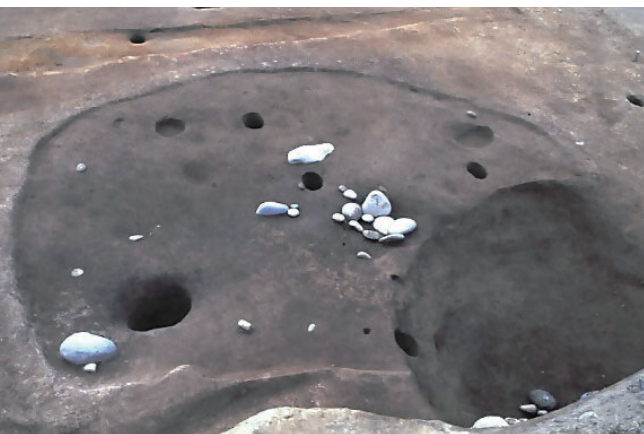
▲下唐原龍右工門屋敷遺跡の上唐原型住居跡

今回は久々に埋蔵文化財についてご紹介し... 縄文時代の遺跡という... 以前に東友枝曾根遺跡や原井三ツ江遺跡について紹介させていただきましたが、他にも一般国道10号建設工事に伴う発掘調査や、唐原地区のほ場整備事業に伴う発掘調査で、縄文時代の遺跡が確認されています。その中で下唐原龍右工門屋敷遺跡を紹介... 現在は、ほ場整備が終了し、すっかり田んぼになっていますが、下唐原龍右工門屋敷遺跡からは縄文時代後期を主体とする遺構や遺物が確認されています。三軒の住居跡が確認されていますが、そのいずれも石垣炉とそれから少し離れた床面に立石が据えられる「上唐原型住居」とよばれるタイプの住居跡です。同じ唐原地区内で上唐原型住居が確認できたのは上唐原型の名称の由来となる上唐原遺跡で確認されている二軒の住居跡です。両遺跡の出土土器を見ると、鐘崎系土器が主体を占めていて、両遺跡の時期はほぼ同じ時期と考えられます。また、両遺跡