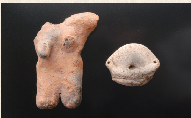
▲下唐原寺前遺跡出土土偶

こうげのみどき 上毛町土記 Vol.212 こうげまちのじょうもんいせき 上毛町の縄文遺跡