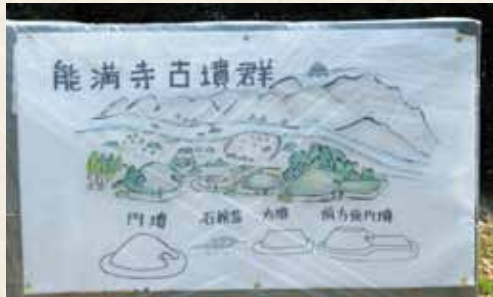
▲能満寺古墳群手作りイラスト

穴ヶ葉山古墳では、みなさん水鳥の線刻壁画に見入っており、また今から千三百年以上前に造られた古墳の、石室に使われた石の大きさに驚かれました。能満寺古墳群では、手作りのイラストが用意されており、現在は埋め戻されて見ることができない弥生時代の石蓋土坑墓から、四世紀中ごろに造られたと考えられる前方後円墳までの四基の墳墓の変遷を熱心に聞き入っていました。四世紀の終末に造られたと考えられる西方古墳では、能満寺前方後円墳よりもさらに大きい前方後円墳の墳丘に登ったり、古墳の周囲に沿って歩いてみたり、その大きさと形を体感していました。最後に金居塚古墳群では、十数基残る円墳の古墳群を、「下唐原・友の会」のみなさんが、歩き