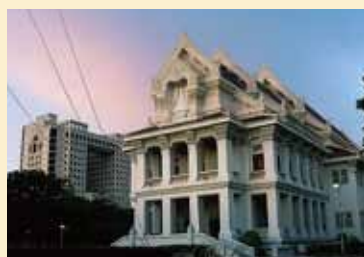
タイ王国 バンコク都 チュラロンコーン大学