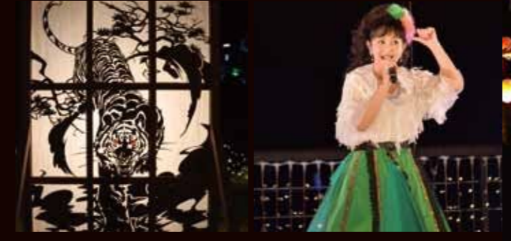
●問い合わせ先 企画開発課 開発交流係 TEL 72-3112(内線126)

※なお、イルミネーションにつきましては、来年1月15日まで引き続き点灯していますのでぜひご来場ください。