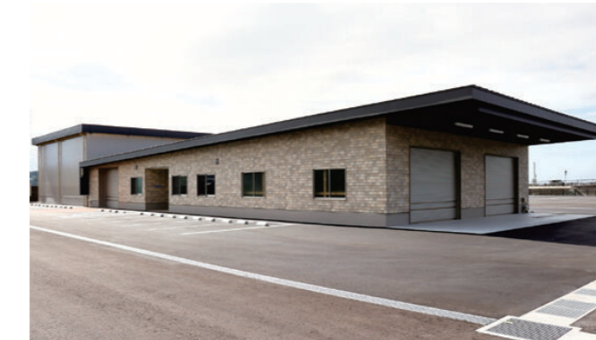
図 総務課 総務係 ☎ 72-3111(内線113)

休館日 土曜日・日曜日・祝日及び 12月29日～1月3日 開館時間 9時00分～16時00分