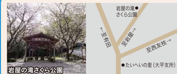
※岩屋の滝さくら公園まで、たいへいの里(大平支所)から約7kmあります。

夏は涼を求め、周りの自然は桜、新緑、紅葉など四季を通じて様々な変化を楽しませてくれます。岩屋の滝は岩屋の滝さくら公園から徒歩で約10分の所にあります。