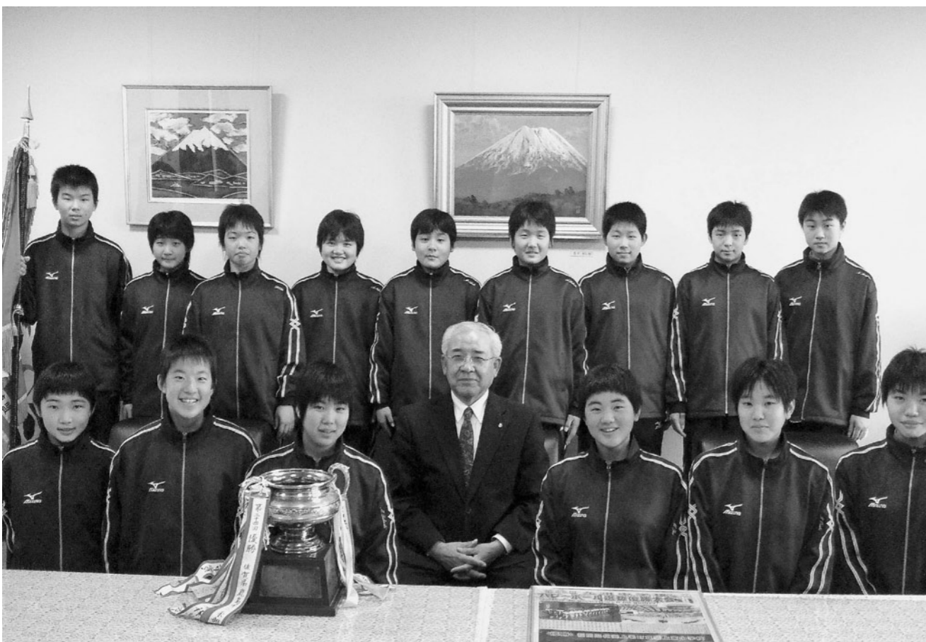
▲築上東中バレーボール部(女子)「第26回アシックスカップ九州中学校バレーボール選抜優勝大会」優勝報告