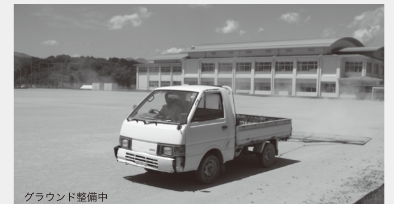
グラウンド整備中

予算総額5192万円のうち、国からの学校施設環境改善交付金が1747万円、町の公共施設整備基金より3400万円を繰り入れしています。