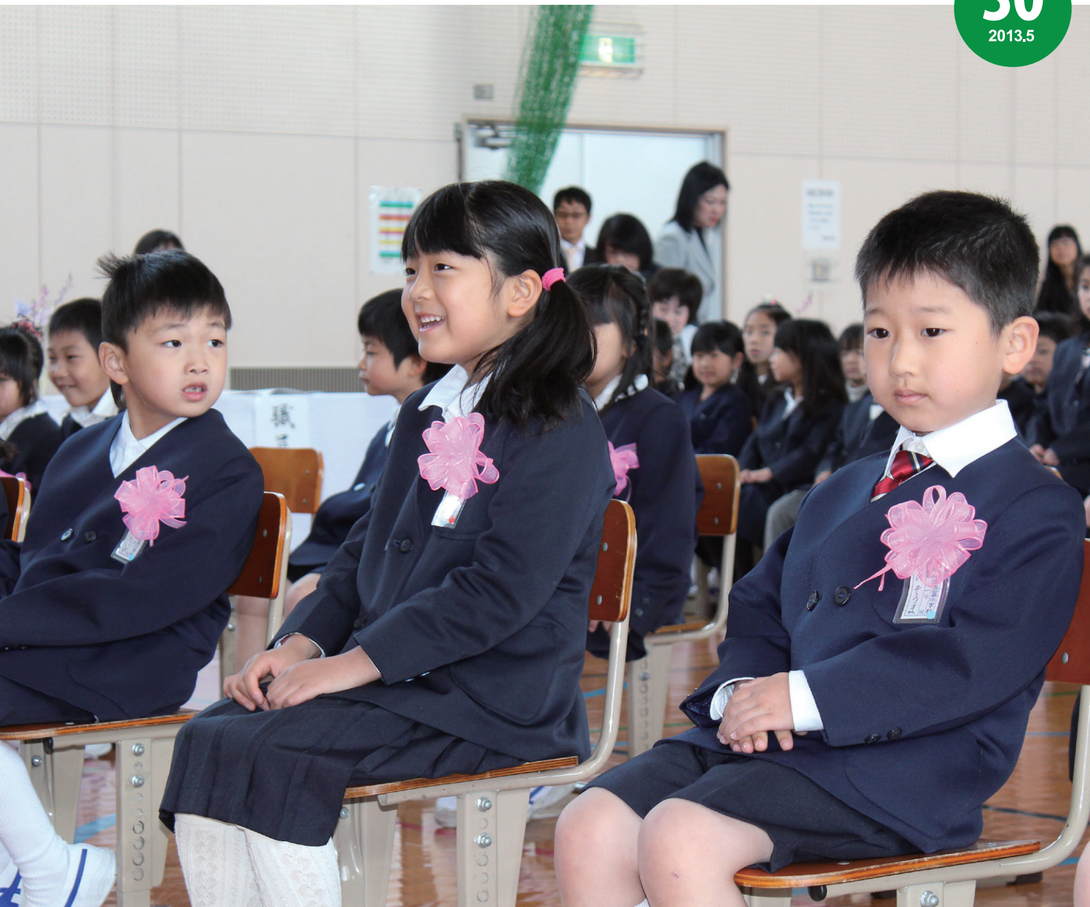
南吉富小学校入学式